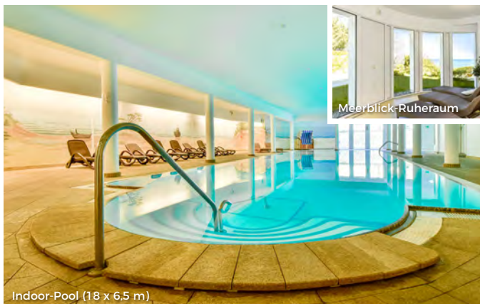
Indoor-Pool (18 x 6,5 m)