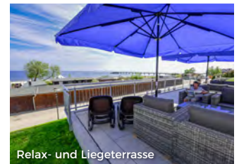
Relax- und Liegeterrasse