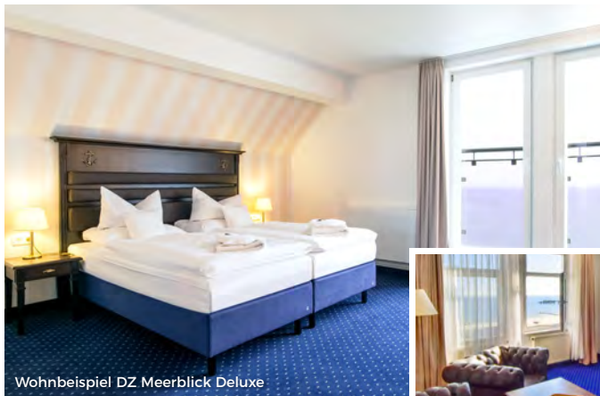
Wohnbeispiel DZ Meerblick Deluxe