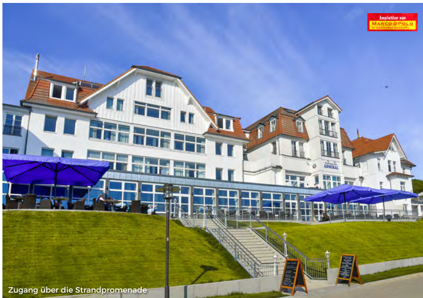
Zugang über die Strandpromenade